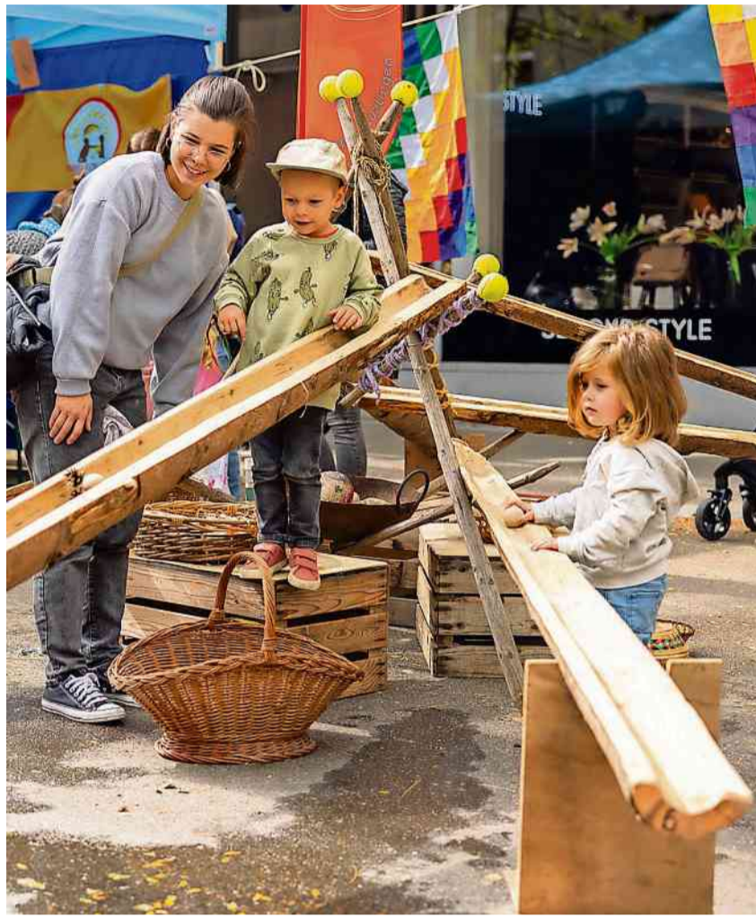
Am Samstag, 21. September, findet auf dem Boulevard das Spielstrassen-Fest statt.